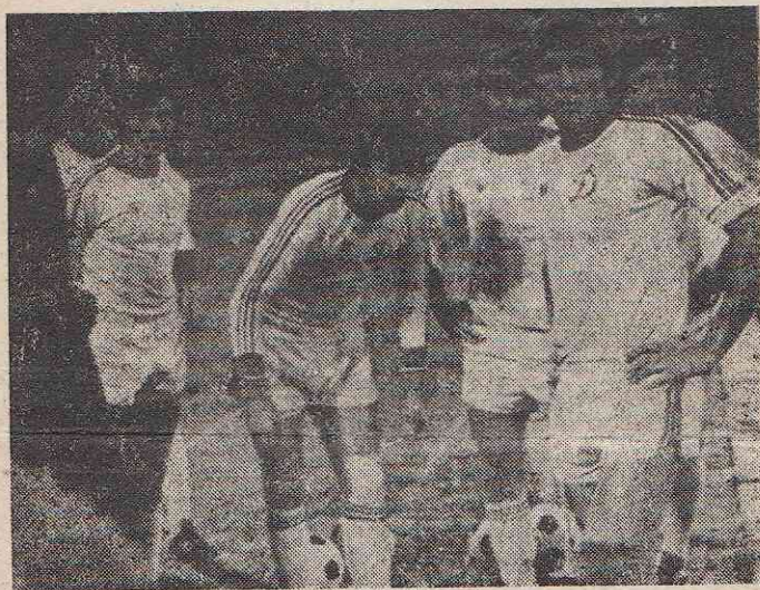
Динамо киевское готовится к выходу на поле

В череде матчей между динамовцами Киева и армейцами столицы выделяем два. Первый — несостоявшийся 22 июня 1941 г. обновленный киевский стадион «Динамо» должен был открыться матчем чемпионата между местным «Динамо» и ЦСКА. Билеты были раскуплены задолго до воскресного дня. Игре не суждено было состояться из-за разбойничьего нападения на нашу страну. Было объявлено, что билеты, проданные на матч 22 июня, будут действительны на встречу этих же команд по окончании войны. И были люди, пришедшие по таким билетам на матч армейцев и динамовцев в победном 1945 г. Второй матч состоялся в августе 1960 г. на Центральном стадионе имени В. И. Ленина в Лужниках. Эта встреча, прошедшая в нервной обстановке, отличалась грубыми приемами футболистов обеих команд и недисциплинированностью зрителей, часть которых выбежала на поле и прервала нормальное течение игры. И хотя порядок скоро был наведен и игра была доведена до финального свистка, зафиксировавшего победу армейцев со счетом 2:1. Федерация футбола СССР решила засчитать армейцам поражение за недисциплинированное поведение их болельщиков.