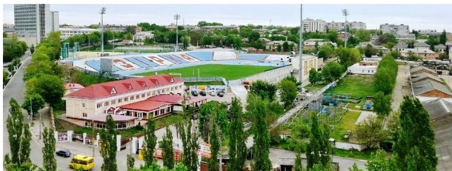
Кировоград. Стадіон «Зірка».

Второй лиги, где она провела еще 2 сезона, находясь в нижней части турнирной таблицы. 11 июля 2006 года «Звезда» была лишена профессионального статуса и снята с чемпионата. В июле 2008 футбольный клуб «Олимпик» был переименован в «Звезду». В дебютном чемпионате возрожденная команда стала чемпионом Второй лиги и вышла в Первую лигу. В сезонах 2009/2010 и 2010/2011 команда занимала 12-е место в чемпионате. В последующих трех сезонах кировоградская команда неизменно улучшала свои показатели: 2011/2012 – 11-е место, 2012/2013 – 8-е, 2013/2014 – 6-е, 2014/2015 – 4-е. В нынешнем первенстве «Звезда» является одним из лидеров чемпионата.