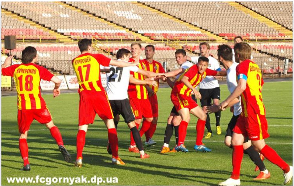
23 травня 2015 року. Стадіон «Металург». «Гірник» - «Зірка» - 1:2.

Примітка: виділено домашні матчі «Гірника».