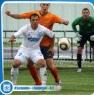
FC «Газпром» - «Энергия» 6:1

4 августа, Рыльчанский, Стадион «Иванов», 500 зрителей.