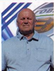
Іван Шуфрич – почесний президент