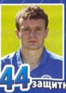
Артем ФЕДЕЦКИЙ Г.Р.: 26.04.1985 Рост: 184 Вес: 84 Игры: 134 (1) Голы: 19