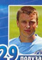
Руслан РОТАНЬ Г.Р.: 29.10.1981 Рост: 178 Вес: 73 Игры: 285 (1) Голы: 30