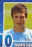
Евгений КОНОПЛЯНКА Г.Р.: 29.09.1989 Рост: 176 Вес: 69 Игры: 110 (1) Голы: 21 (1)