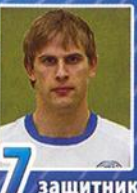
Иван СТРИНИЧ Г.Р.: 17.07.1987 Рост: 186 Вес: 78 Игры: 54 (1) Голы: 4