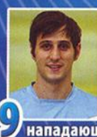
Никола КАЛИНИЧ Г.Р.: 05.01.1988 Рост: 187 Вес: 81 Игры: 41 (1) Голы: 16