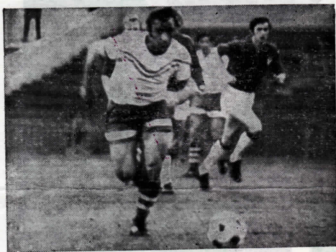
1974 г. ЦСКА — «Динамо» (Тбилиси). Эпизод матча.