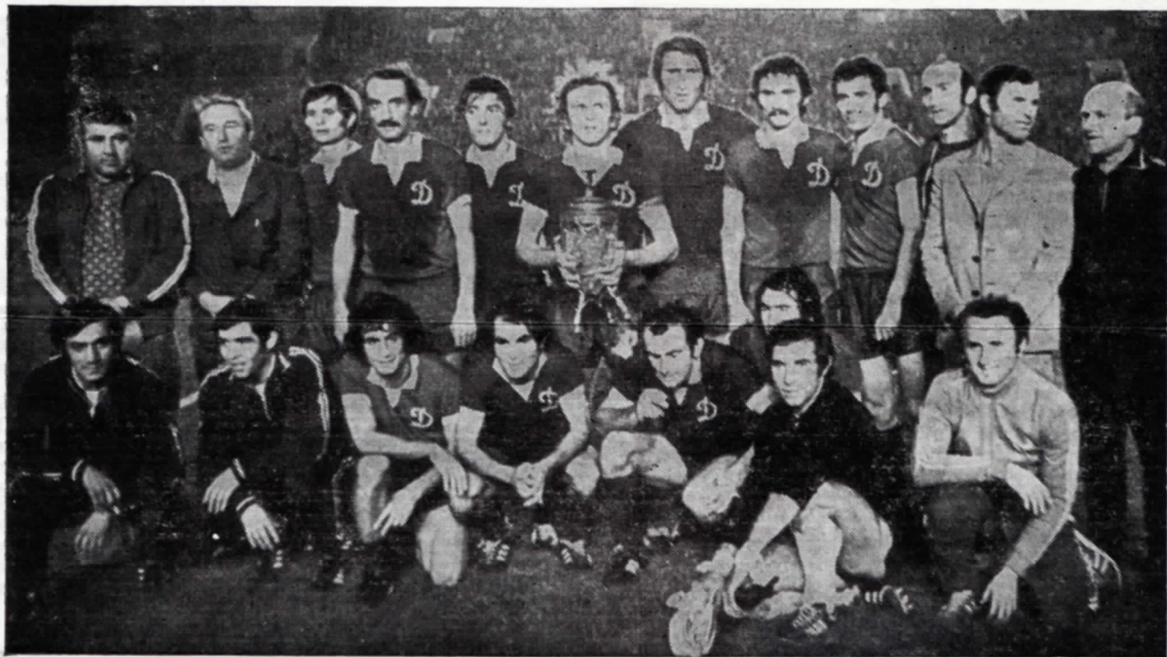
«Динамо» (Тбилиси) — обладатель Кубка СССР 1977 г.