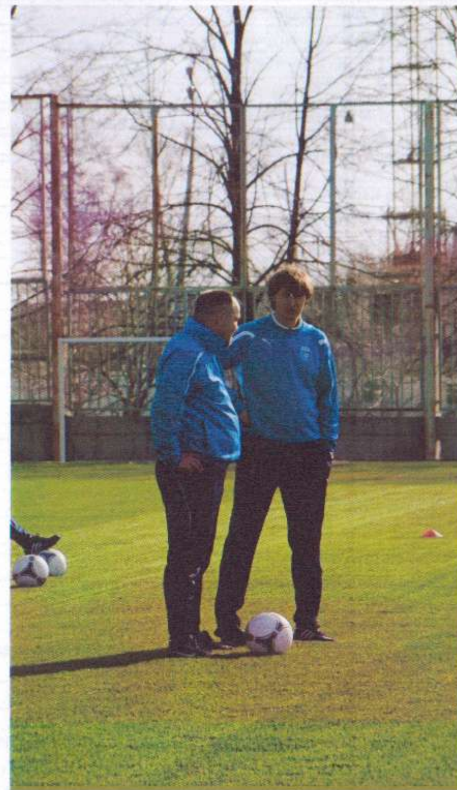
5 апреля. Тренировка в УТЦ стадиона «Торпедо»