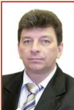
Президент РЕЗНИК Александр Иванович