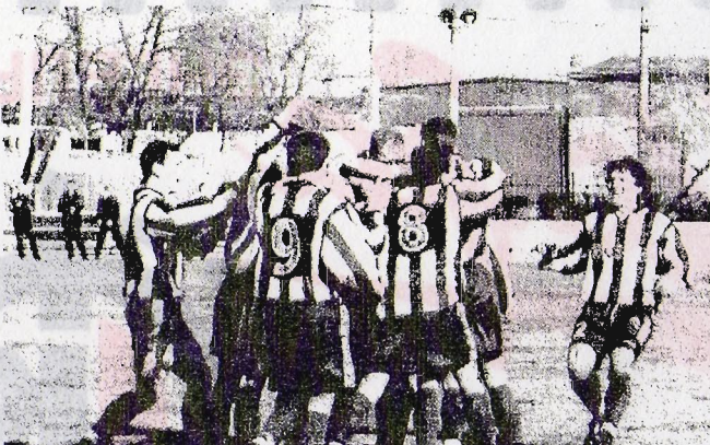
Скоро «ИСКРА» вновь будет радоваться забитым мячам и победам!