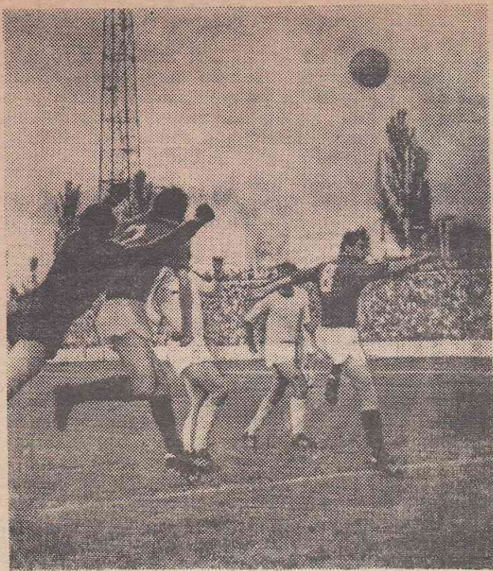
Эпизод матча «Днепр» — «Карпаты». Опасный момент у ворот гостей