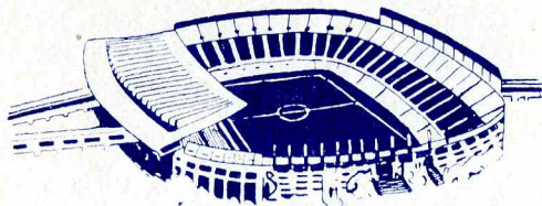
Стадион «Ной Кампо».

проходить по новой системе, 24 команды ныне будут разыгрывать почетное звание, а не 16, как было ранее. Все матчи пройдут на крупнейших стадионах Испании: «Сантьяго Бернабеу». Размер поля 105×72 м. Вместимость 120000 зрителей. Принадлежит клубу «Реал» (Мадрид). Здесь пройдет финал.