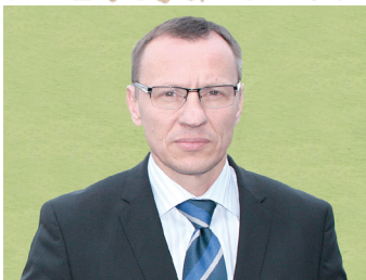
Евгений Геннадиевич Калакуцкий Президент