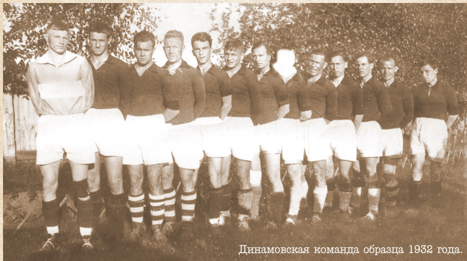
Динамо́ская команда образца 1932 года.