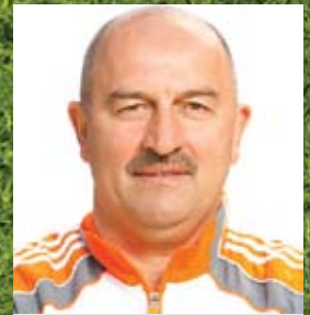
Станислав Черчесов Главный тренер

* средняя оценка по версии onedivision.ru