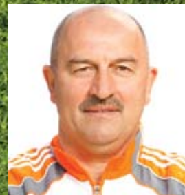
Станислав Черчесов Главный тренер

* средняя оценка по версии onedivision.ru