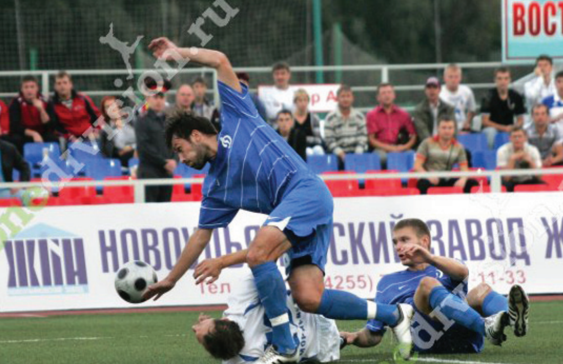
Первенство России. Первый дивизион. 26-й тур