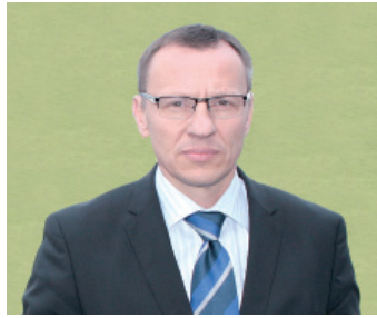
Евгений Геннадиевич Калакуцкий Президент