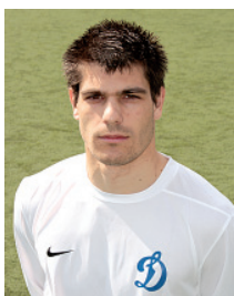
28 Эдин Днузович Родился 28.04.1986 г. Рост 188 см Вес 84 кг