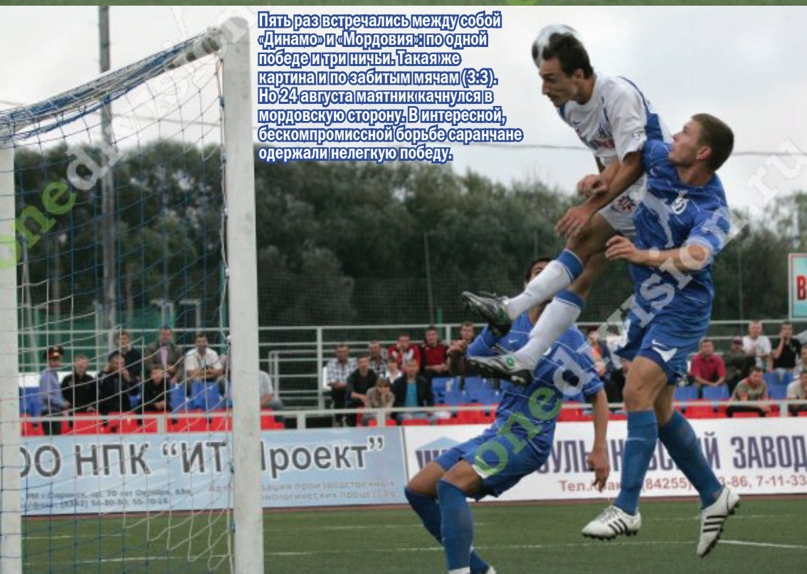
Пять раз встречались между собой «Динамо» и «Мордовия»: по одной победе и три ничьи. Такая же картина и по забитым мячам (3:3). Но 24 августа маятник качнулся в мордовскую сторону. В интересной, бескомпромиссной борьбе саранчане одержали нелегкую победу.