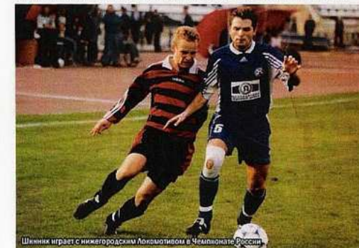
Шинник играет с нижегородским Локомотивом в Чемпионате России

Первый матч в высшей лиге, к тому же первый матч в чемпионате вообще. На нейтральном поле в Тбилиси ярославцев экзаменовало минское «Динамо» - бронзовый призер года предыдущего. «Борьба равных» - так озаглавила газета «Правда» отчет о первой игре «Шинника». В ней была зафиксирована ничья - 1:1. Первый гол в элите у наших парней забил А. Лозовский. Ничья воодушевила болельщиков. Бытовало мнение, что уж если «Шинник» и не блеснет, то и не вылетит точно. Но жизнь рассудила по другому. Хотя еще в начале октября команда сохраняла шанс закрепиться в высшей лиге, однако