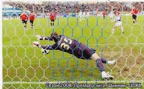
Сезон 2008. Премьер-лига. Шинник - ЦСКА