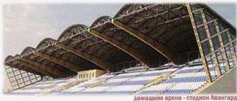
Домашняя арена - стадион Авангард