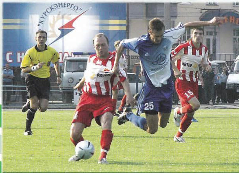
Фотографии на обложке Георгия Гонголевича