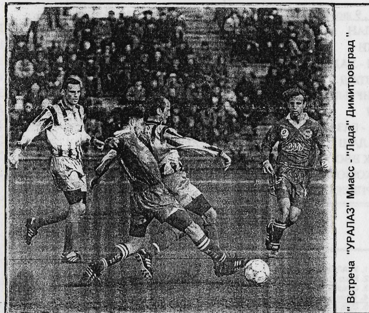
"Встреча "УРАЛАЭ" Миасс - "Лада" Димитровград"