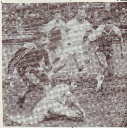
Острый момент у ворот соперников