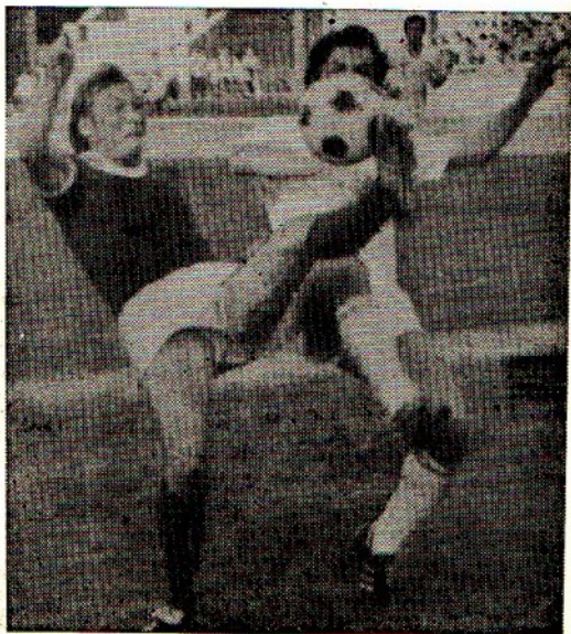
Упорная борьба за мяч