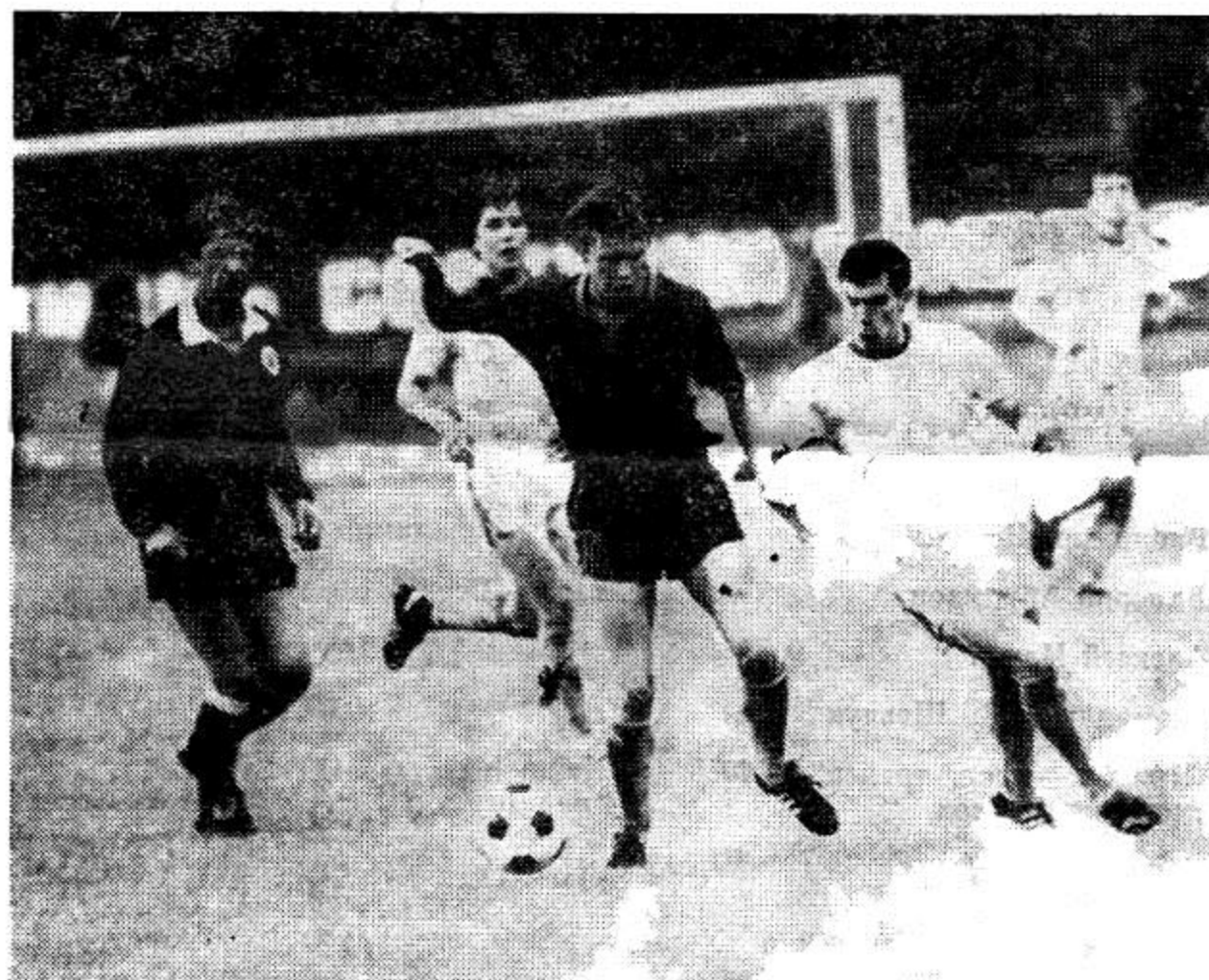
1983 г. «Локомотив» — СКА (Хабаровск). Момент игры