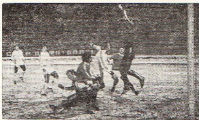
1982 г. «Локомотив» — «Факел».

Нередко после бурного старта в чемпионате его весенний лидер в разгар сезона оказывается вдали от высоких мест (самый свежий пример — одесский «Черноморец» в высшей лиге). Или наоборот, пребывавшая в тени команда осенью спуртует, и на финише ей до призового места не хватает совсем немного того, что было потеряно весной. У многих коллективов нередки спады и подъемы в течение сезона.