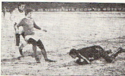
1982 г. «Локомотив» — «Факел».

«Факел» — одна из самых возрастных команд лиги, средний возраст игроков основного состава — 26,5 года.