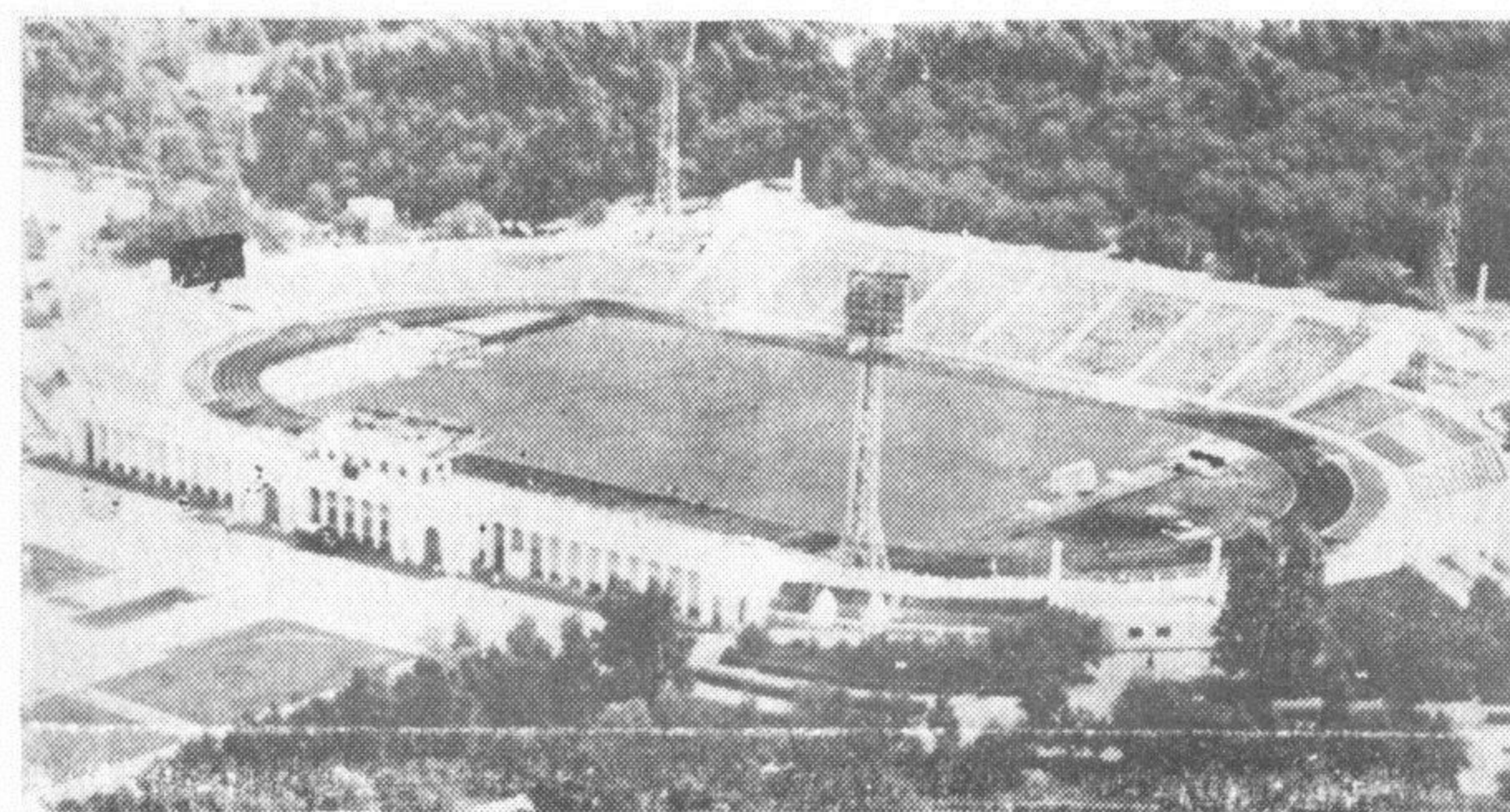
Стадион им. В. И. Ленина (Хабаровск).