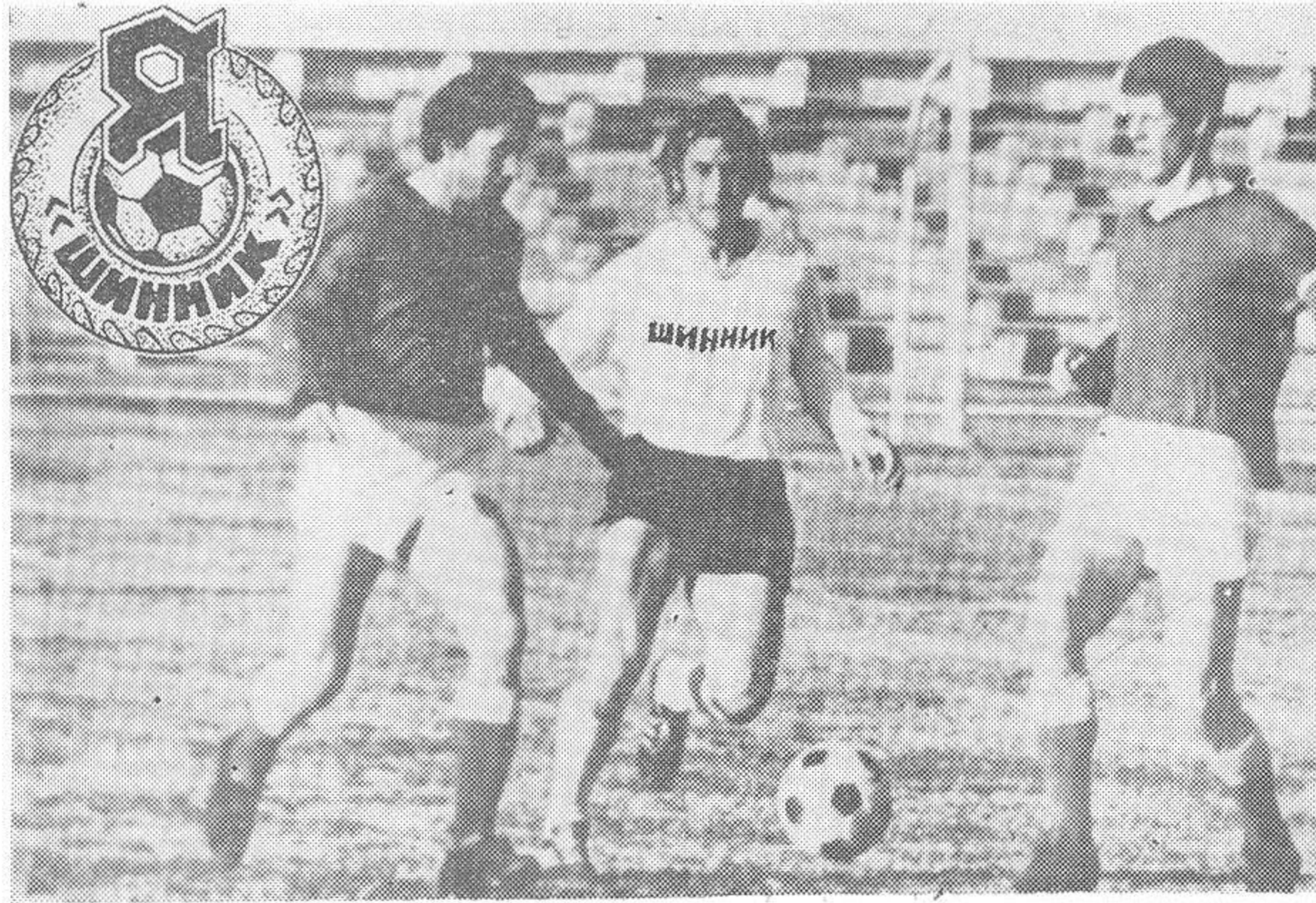
Матч на Кубок СССР между командами «Шинник» (Ярославль) — «Уралец». Мяч под контролем та-

кент) — 0:2, 1959 г. «Металлург» — «Уралмаш» (Свердловск) — 0:1, 1960 г. «Металлург» — «Металлург» (Магнитогорск) — 0:1, 1961 г. «Металлург» — «Строитель» (Уфа) — 0:1, 1962 г. «Уралец» — «Зенит» (Ижевск) — 1:5, 1963 г. «Уралец» — «Искра» (Казань) — 0:1, 1964 г. «Уралец» — «Металлист» (Джамбул) — 2:3, 1965 г. «Уралец» — «Торпедо» (Павлово-на-Оке) — 0:1, 1966 г. «Уралец» — «Торпедо» (Миасс) — 1:0, «Химик» (Березники) — 7:0, «Металлург» (Златоуст) — 1:0, «Чайка» (Зеленодольск) — 0:1, 1967 г. «Уралец» — «Локомотив» (Оренбург) — 1:0, — «Каучук» (Стерлитамак) — 1:2.