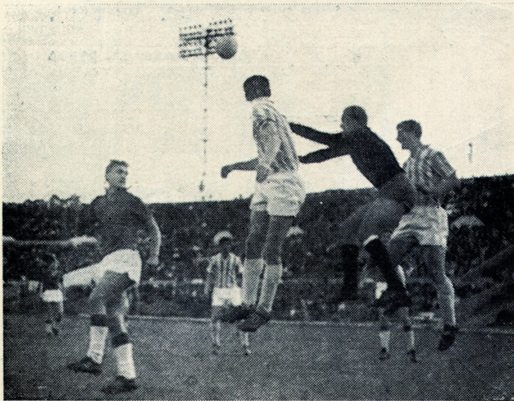
Кубок СССР 1969 г. ЦСКА — «Автомобилист» (Житомир)

Итак, проходила ночь, полная волнений и надежд. С самого утра у ворот стадиона «Динамо» началось оживление. Те, кому не удалось раздобыть билеты на матч, толпились у касс, стараясь не смотреть на аншлаг, начертанный чьей-то жестокой рукой, — «Все билеты проданы». После полудня по Ленинградскому шоссе потянулась нескончаемая вереница машин. Из вестибюлей метро начали прибывать болельщики. Знатоки и поклонники футбола заполнили стадион до начала игры.