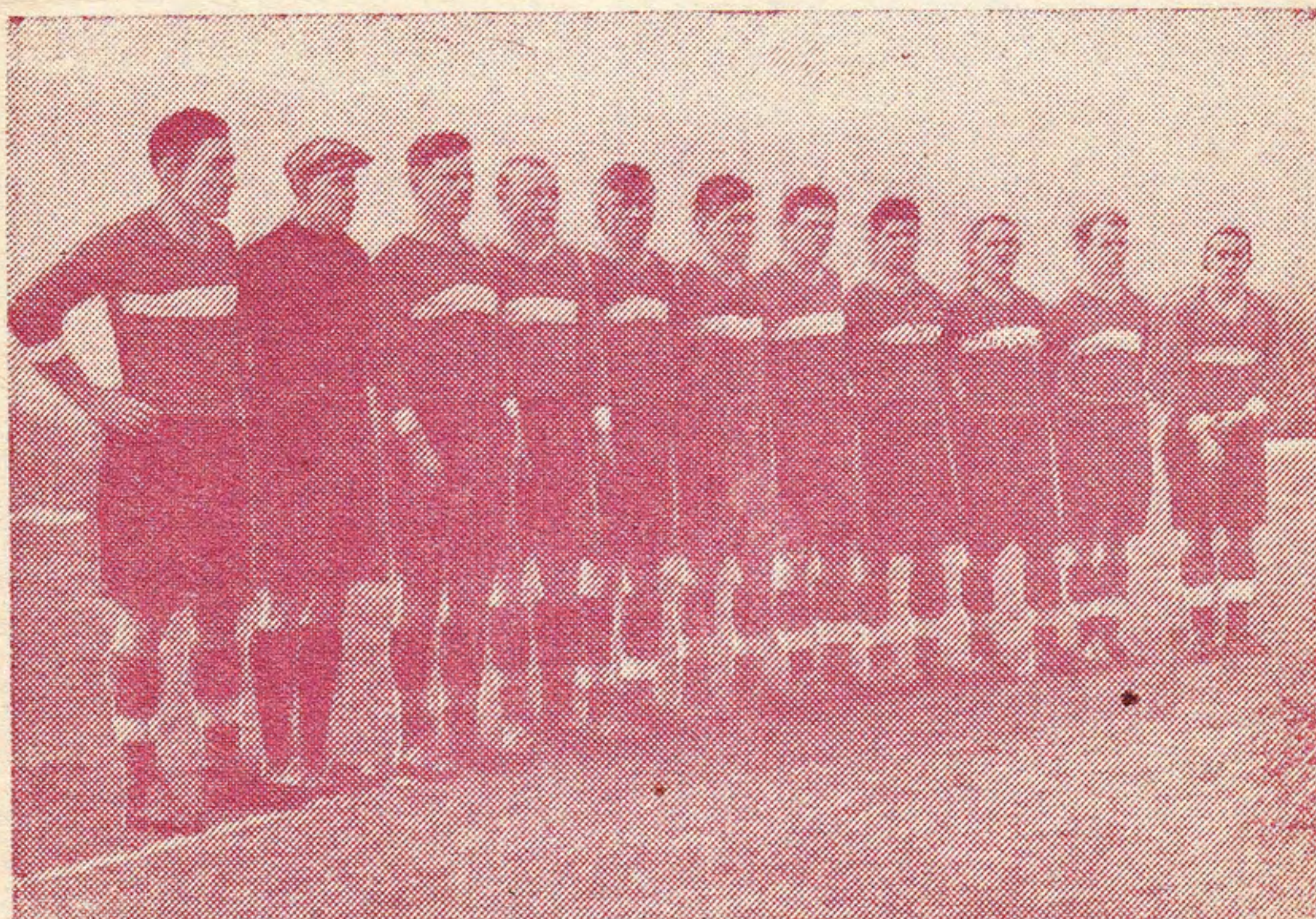
„Спартак“—финалист кубка СССР 1939 г.

ВОЗМОЖНЫЕ ИЗМЕНЕНИЯ В СОСТАВЕ СЛУШАЙТЕ ПО РАДИО ПЕРЕД МАТЧЕМ