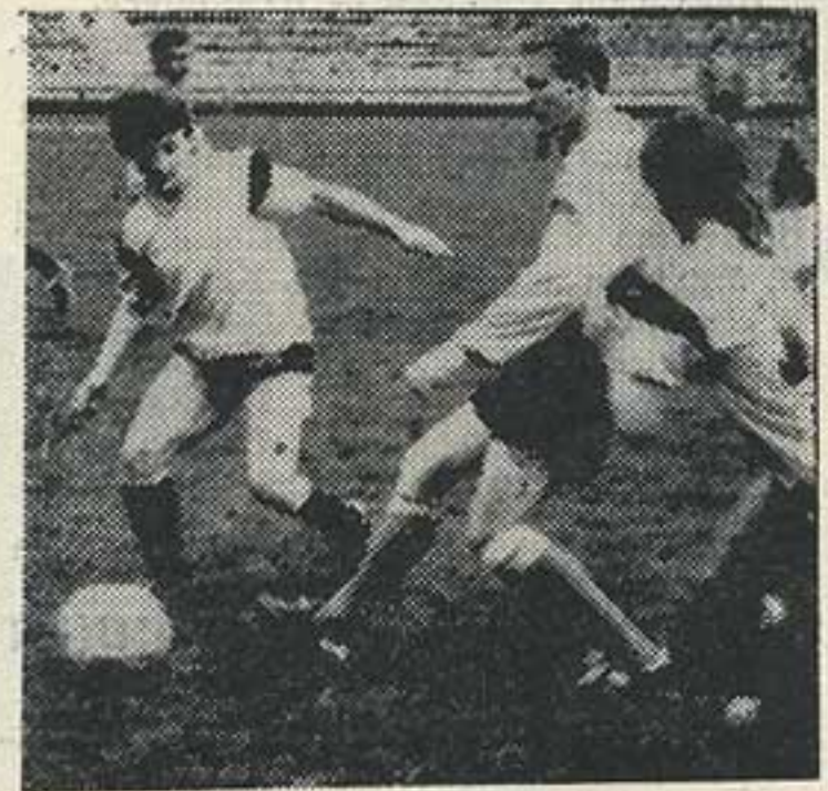
На снимке: играют лутугинский «МАЛС» и луганское «Динамо».

До последней игры первого круга лутугинский «Металлург» и перевальская «Украина» имели одинаковое количество очков — по 10. Победа лутугинцев над перевальцами в этом матче со счетом 2:1 да-