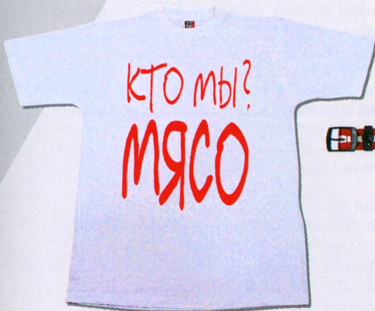
Хлопчато-бумажная майка 160 руб.