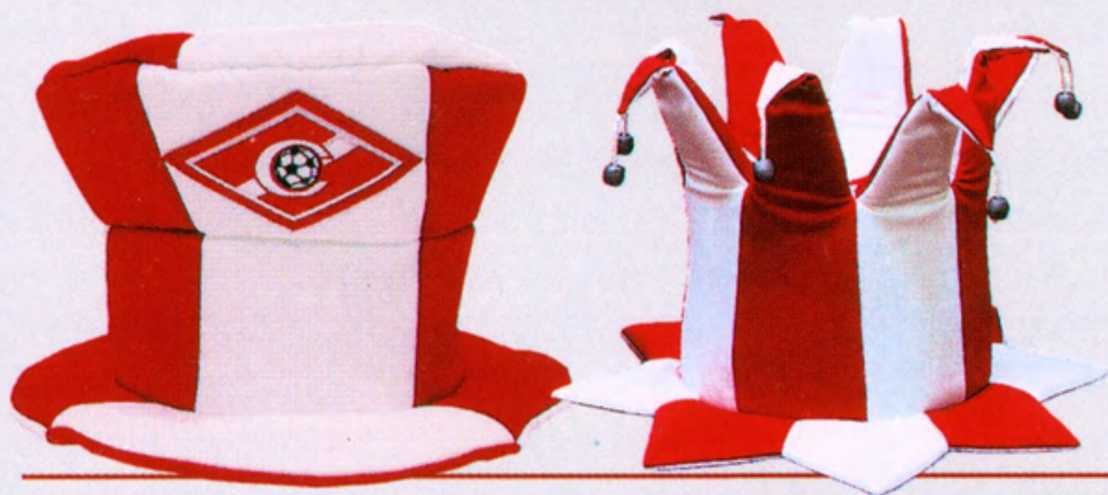
Шарфы болельщиков с символикой «Спартак» 250 руб.

С 1 июля по 31 июля вы можете приобрести эти и другие товары со скидкой 5% ТОЛЬКО в магазине Торгового дома