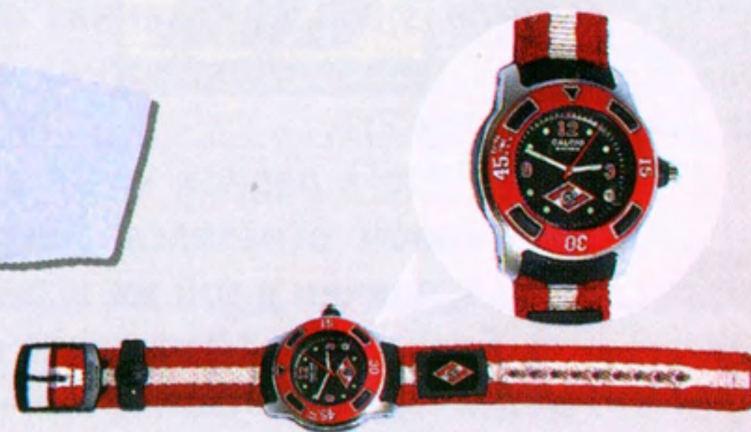
Часы «CALCIO» (пр-во Швейцария) 1800 руб.

Перекидной календарь с фотографиями игроков «Спартак» (29x42 см) 150 руб.