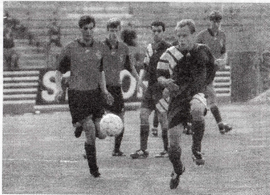
Чемпионат-96. Играют ЦСКА и «Жемчужина»

В 93-м и 94-м годах «Жемчужина» была для столичных армейцев соперником крайне неудобным. В московских матчах с этой командой це-