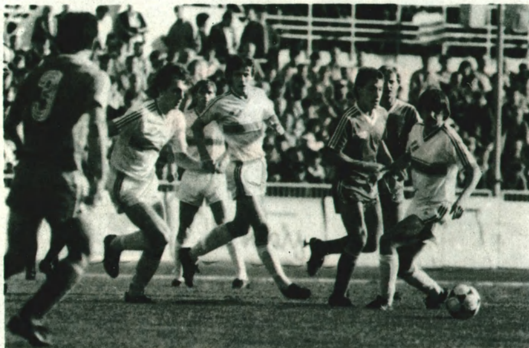
Когда играют «Днепр» и «Спартак», борьба за мяч ведется на любом участке поля.