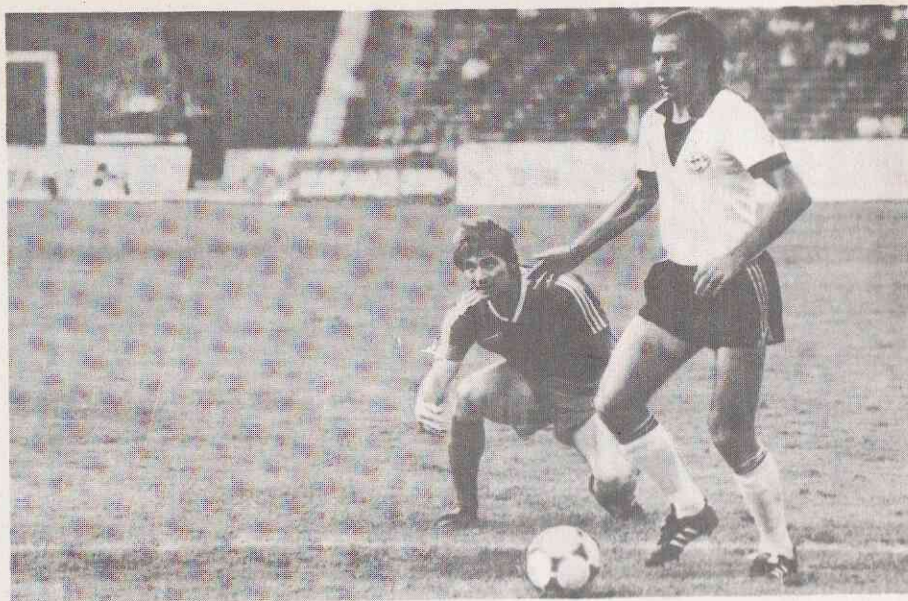
Встречаются давние соперники — «Днепр» и «Шахтер».