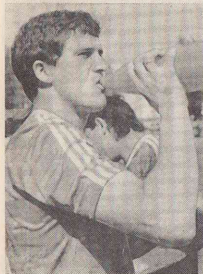
Олимпийский чемпион Сеула Е. Яровенко.