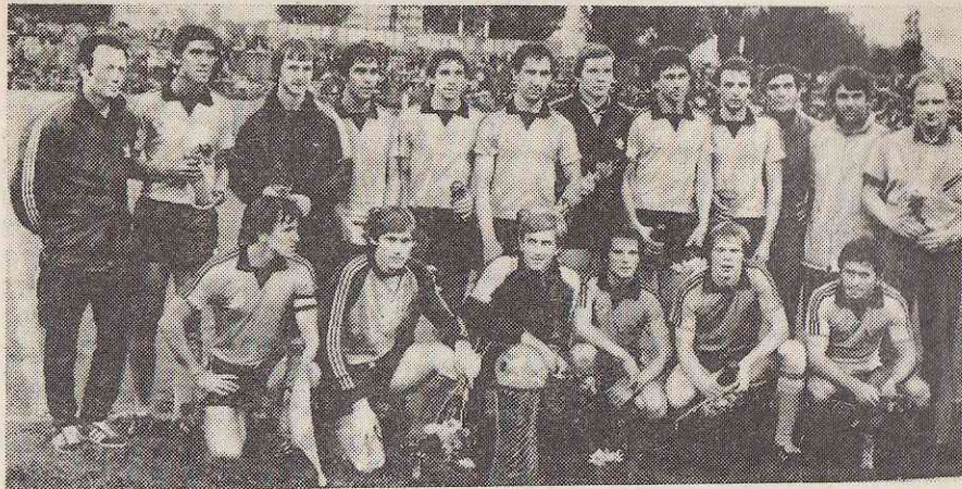
Донецкий «Шахтер» с Суперкубком на стадионе «Метеор».