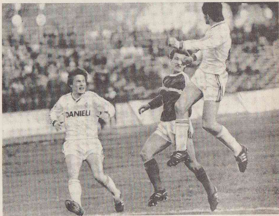
Один против двоих.

В Советском Союзе, кроме Москвы, имели больше чем одну команду высшей лиги только Ленинград и Одесса (имеется в виду — одновременно).