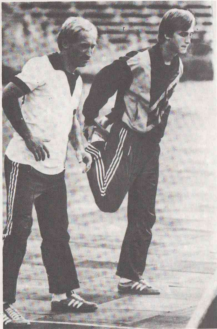
Запасные игроки «Шахтера» на разминке.