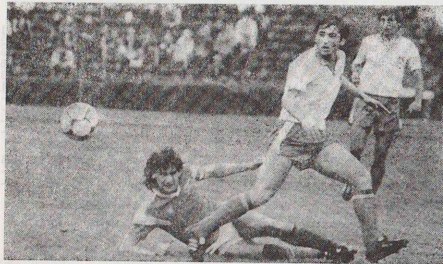
Играют «Днепр» и «Памир». Атакуют душанбинские футболисты (в светлой форме).

В прошлогоднем чемпионате обе встречи сегодняшних соперников закончились победами «Днепра»: 1:0 в Душанбе и 2:0 — на «Метеоре».