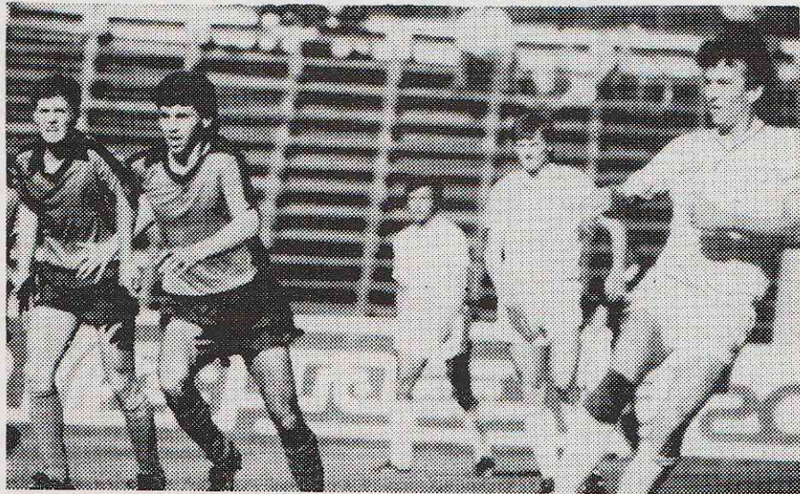
«Днепр» — «Аратат»: матчи всегда проходят остро и интересно.