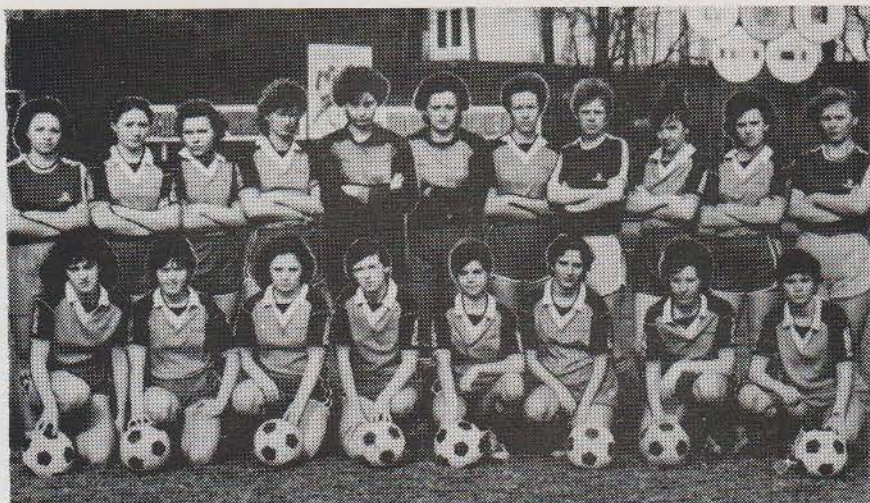
На снимке: женская футбольная команда кооператива «Самарский».