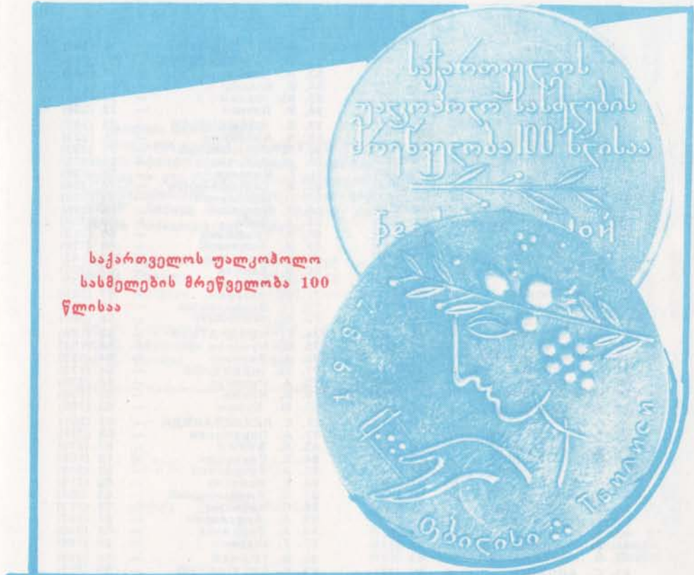
საქართველოს უაღლოპოლო სასმელების მრეწველობა 100 წლისა

— კუთხური იყო, — ჩაერთო დავაში ვატმანი, — ახლავე გიჩვენებთ, რანაირად:ც მოხდა, — ჩანთა აიღო და ჩავიდა. ჩვენც ჩავყვეით. უკან ოციოდე მანქანა