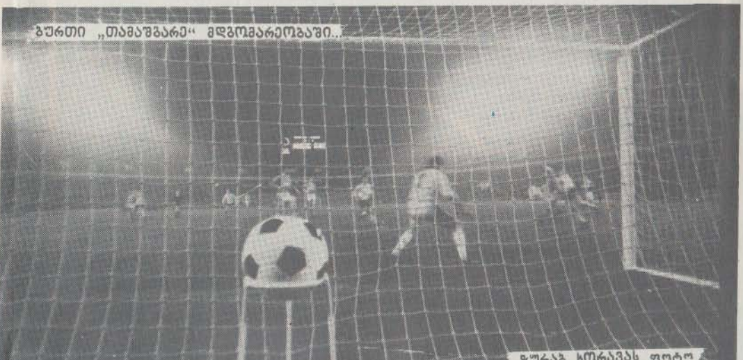
ბურთი „თამაზბარა“ მდგომარეობაში...

სუდები: А. Кириллов, В. Гуськов, А. Хорлин (все — Москва). ИНСПЕКТОР: А. Васильев (Ленинград)