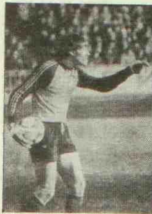
Вратарь донецкого «Шахтера» Валентин Елинскас дает указания защитникам