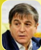
Осман КАДИЕВ президент