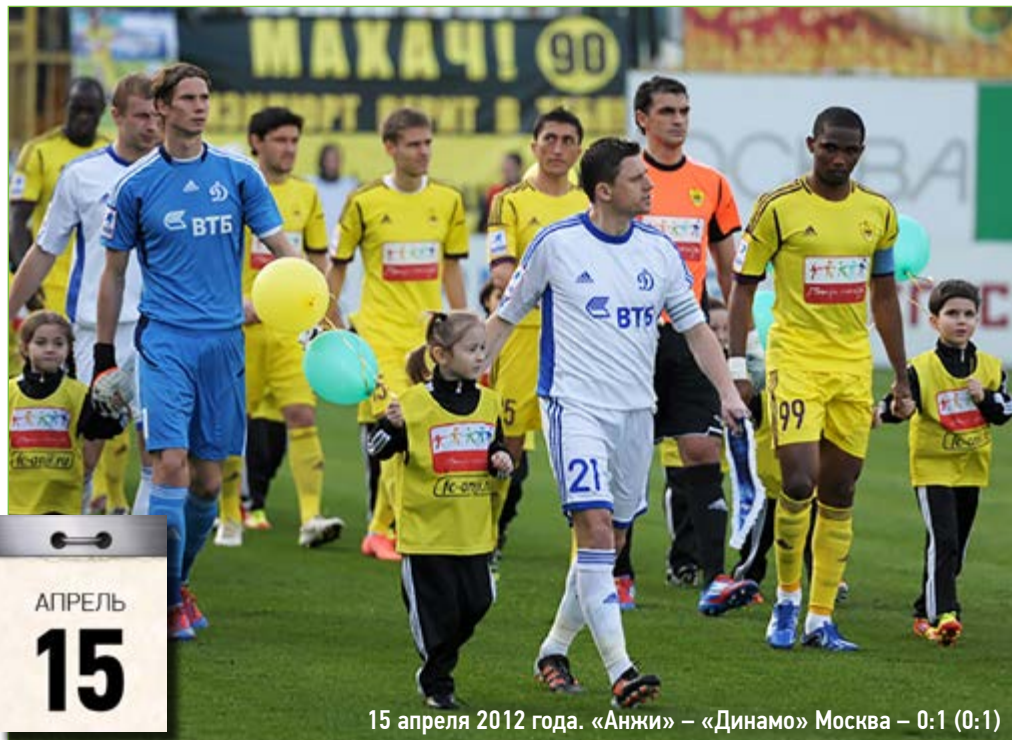
15 апреля 2012 года. «Анжи» – «Динамо» Москва – 0:1 (0:1)