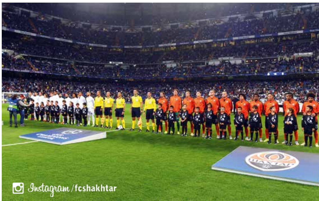
«Шахтар» (Донецьк, Україна) – ПСЖ (Париж, Франція)

Головною ж сенсацією перших ігрових днів стала перемога загребського «Динамо» над «Арсеналом» 2:1 завдяки м'ячам Піварича й Фернандеса. У паралельній грі групи F «Баварія» з Дугласом Костою у складі на класі розібралась з «Олімпіакосом» – 3:0.