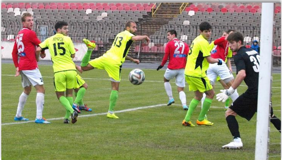
16 листопада 2014 року. Кривий Ріг. Стадіон «Металург». «Гірник» - Сталь» - 0:1.

Примітка: виділено домашні матчі «Гірника».