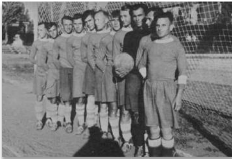
«Сталь» Днепродзержинск. 1946 год.

С 1935 г. команда участвует в первенстве Украины (правда, в 1935-1936 гг. под флагом сборной города, основу которой составляли металлурги), а в 1936 и 1938 году принимает участие в розыгрыше Кубка СССР. В 1938 году "Сталь" стала вторым призером республиканского чемпионата, т.е. фактически, восьмой командой Украины, уступив лишь участникам союзного первенства - киевским "Динамо" и "Локомотиву", харьковским "Сельмашу" и "Спартаку", одесскому "Динамо", сталинскому "Стахановцу", а