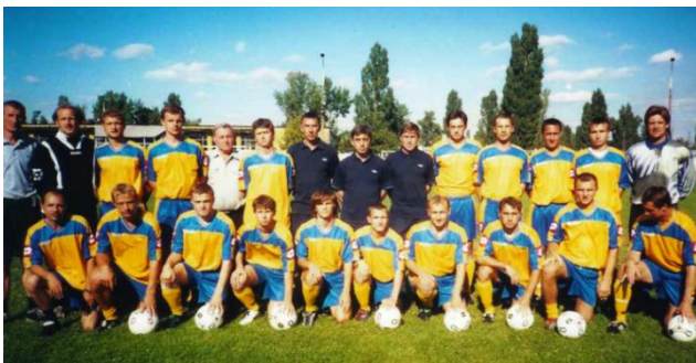
«Сталь» - переможець групи першості 2-ї ліги 2003/2004 рр.

причем во 2-ом круге команда показала шестой результат. В следующем сезоне достижения "Стали" были уже повесомее - 5 место в турнирной таблице, причём долгое время команда шла в тройке. Ну а триумфальным для днепродзержинцев стал сезон 2003/04, когда в увлекательной борьбе с черниговской "Десной"