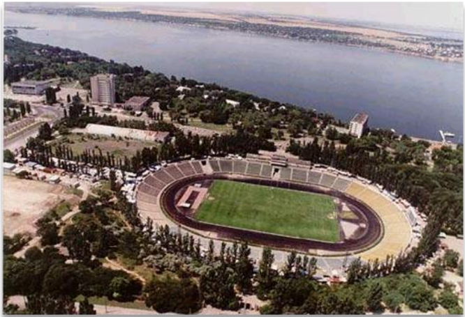
Миколаїв. Центральний стадіон. 90-ті роки минулого століття.