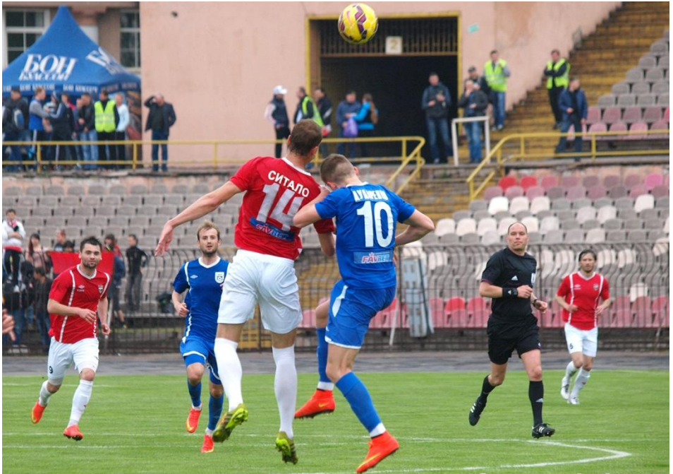
2 травня 2015 року. Кривий Ріг. Стадіон «Металург». «Гірник» - «Миколаїв» - 3:1.

Примітка: виділено домашні матчі «Гірника».