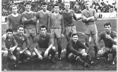
«Суднобудівник» - 1968