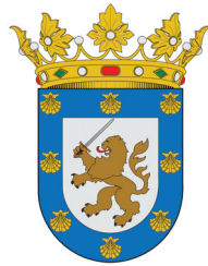
Герб города Сантьяго

В те достопамятные времена любой вояж за границу, а тем более такой дальний перелет в Чили был сродни целому отдельному приключению. Ярославцы добирались до Сантьяго двое суток. Команда выехала на автобусе из родного города 20 февраля в 19 часов, а приземлилась в столице Чили 22 февраля в 20 часов по московскому времени. Время путешествия вместило в себя перелет на ИЛ-86 по маршруту Москва — Буэнос-Айрес с посадками