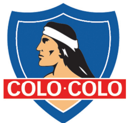
Эмблема клуба «Коло-Коло»

Следующие матчи турнира проводились 25 февраля в г.Ранкагуа в 80 км от