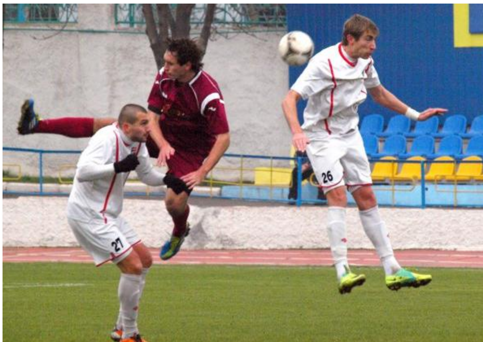
Минулорічний матч «Гірника» та «Енергії» у Кривому Розі на стадіоні «Шахта Октябрська».

Примітка: виділено домашні матчі «Гірника».