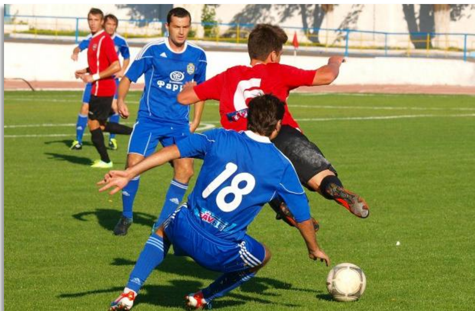
Фотоепізод минулорічного матчу сьогоднішніх суперників у Кривому Розі.

Примітка: виділено домашні матчі «Гірника».