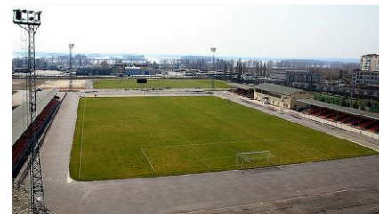
г. Комсомольск-на-Днепре. Спорткомплекс «Юность».