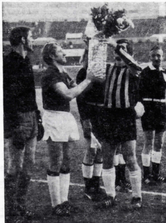
1972 г. Футболисты «Нефтчи» поздравляют команду ЦСКА после вручения ей приза «Честь флага»

А зрителям, пришедшим сегодня на наш стадион, конечно же, хочется увидеть настоящий боевой поединок двух незаурядных футбольных коллективов.