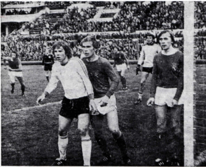
1977 г. ЦСКА — «Торпедо». Угловой у ворот армейцев

когда «Нефтчи» удастаивался бронзовых наград чемпионата, второй — когда кировабдское «Динамо» стало представлять республику в высшей лиге. И вот прошлой осенью, после четырехлетнего пребывания в первой лиге, лучшая команда Азербайджана перешла в высшую лигу, в третий раз порадовав своих почитателей.