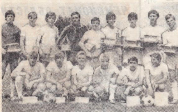
На снимке: сборная области—обладатель Кубка ЦК ЛКСМУ «Надежда».

(Без учета встречи «Локомотив»—«Пахтакор»).