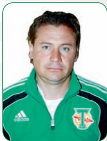
Андрей КАНЧЕЛЬСКИЙ Родился: 23.01.1969. Должность: главный тренер.