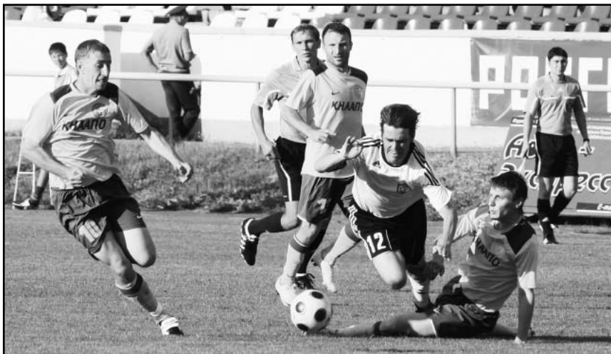
Как ни старались футболисты «Читы» пройти оборону «Смены», забить им так и не удалось.

После матчей 19-го тура в зоне «Восток» интрига обострилась. Формально «Радиян-Байкал» по-прежнему продолжает возглавлять турнирную таблицу. Однако потенциальный лидер сегодня – красноярский «Металлург-Енисей», у которого меньше потерянных очков. Кроме того, с иркутской командой по потерянным очкам сейчас сравнились «Кузня» и «Сахалин».