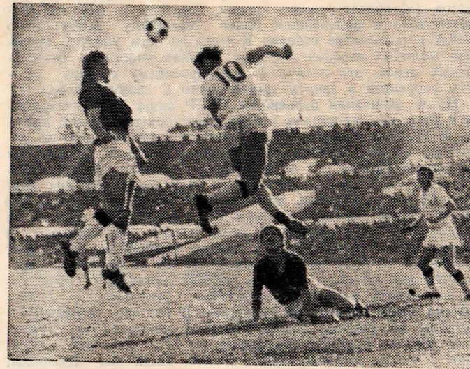
Воздушная дуэль. 1973 г. ЦСКА — «Зенит»