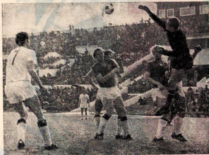
Острый момент в штрафной площади гостей. 1973 г. ЦСКА — «Зенит»