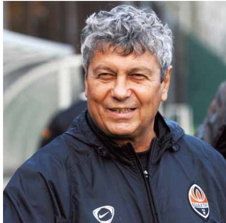
Главный тренер Мирча ЛУЧЕСКУ (Румыния)